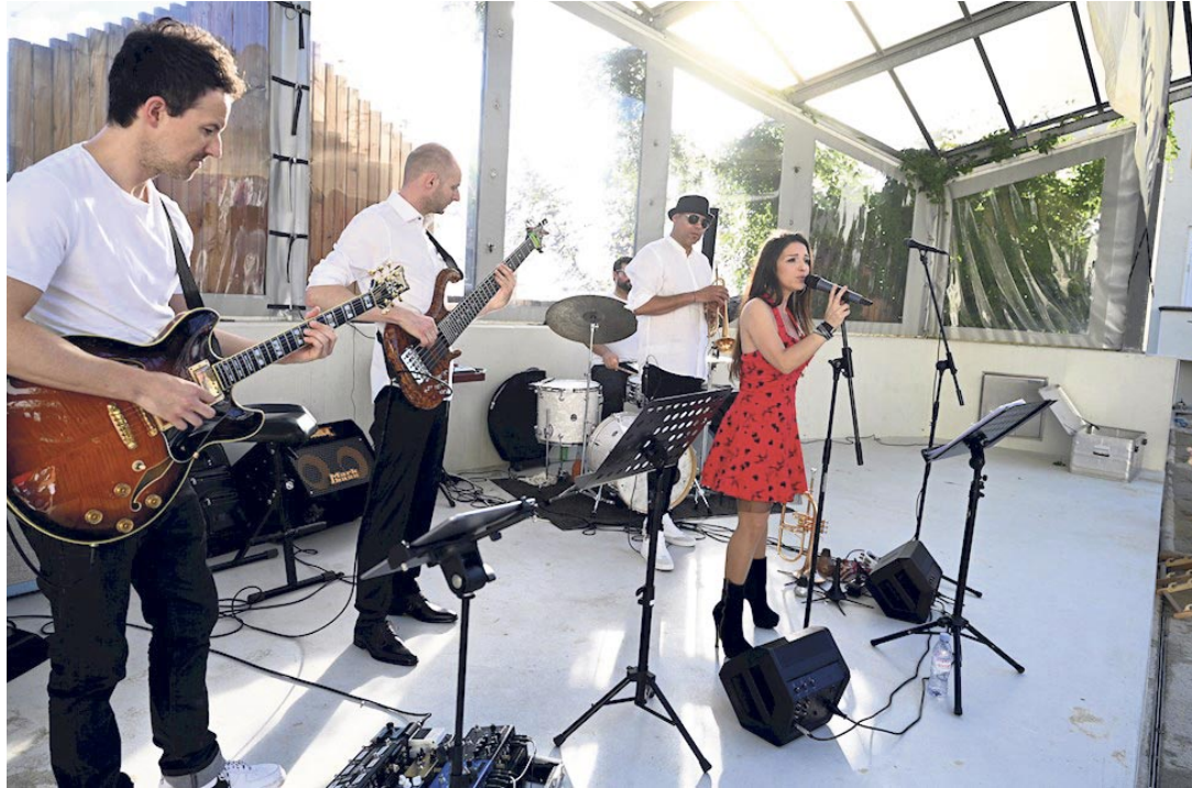
Grenzen überwinden: Eine Band mit Musikern aus vier Ländern gab das Schlusskonzert.

Nach dem Mitmachnachmittag «Sommer.Sonne.Entdeckungsreise» zum Thema Reisen am Mittwoch fand am Donnerstagabend im Alten Kino die «Alpinale on Tour» statt. Fünf eigens ausgesuchte Kurzfilme des internationalen Alpinalen Kurzfilmfestivals in Bludenz, die von jungen Menschen erzählten, die ihre Grenzen über-