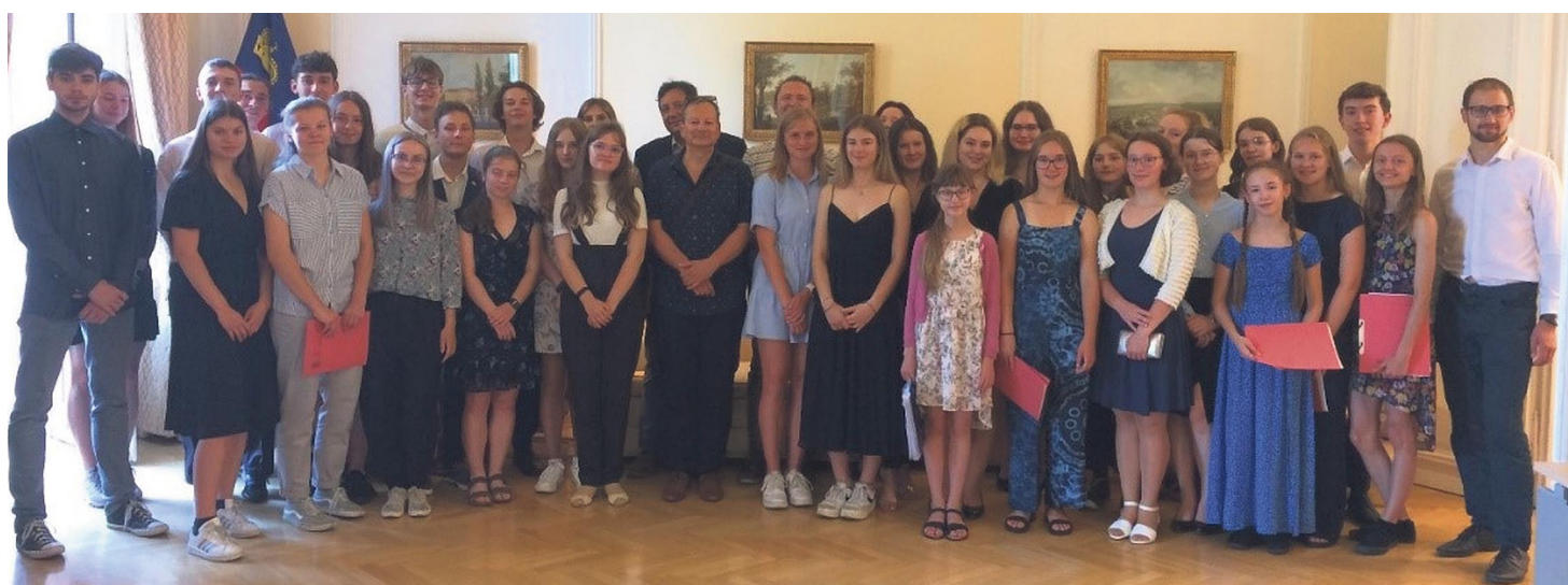
Schüler aus Brünn besuchten vergangene Woche Liechtenstein.

Wie bei den letzten Malen wurde der Schüleraustausch über den bilateralen Fonds des EWR-Finanzierungsmechanismus (EEA Grants) mitfinanziert. Hintergrund für diese Projektzusammenarbeit im Bildungsbereich sind die deutsche Sprache, welche die tschechischen Schülerinnen und Schüler am Gymnasium erlernen, und die